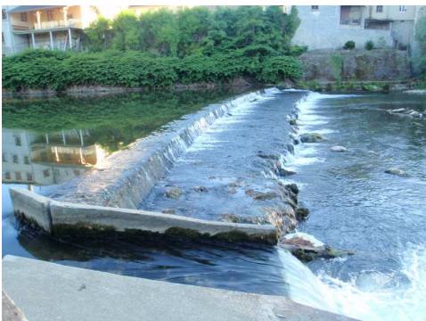
Seuil de Pont de Beauvoisin et la passe à canoë

Contacts : Club de Canoë-Kayak de Chambéry-Le Bourget du Lac (04-79-26-13-51).