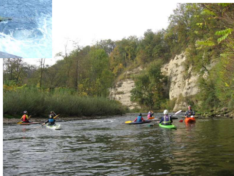
Falaise de molasse